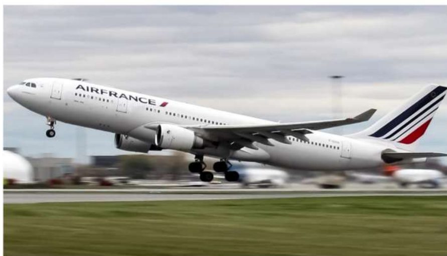
L'Airbus 330-200 di Air France

WonderMiles , è la piattaforma di selfbooking di ACI blueteam , l'azienda specializzata nei servizi in ambito business travel, MICE, leisure e servizi alle agenzie, tra le prime 5 realtà di Travel Management Company per volumi in Italia.